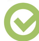
Restolja / partikel