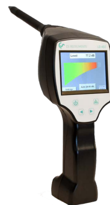
LD 450 med riktrör med riktspets för punktexakt lokalisering.