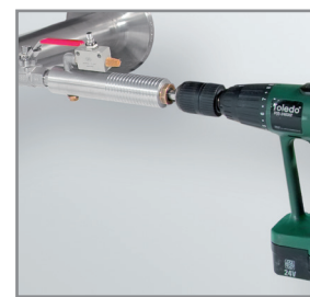
在有压力情况下使用 CS 钻孔装置钻孔