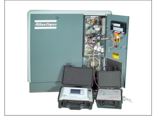
Örnek: Kompresörde ölçüm

Tüm ölçüm verileri dijital olarak (Modbus) DS 500 mobil / DS 400 mobil'e aktarılır ve burada kaydedilir .