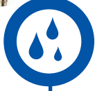
Basınçlı çiy noktası