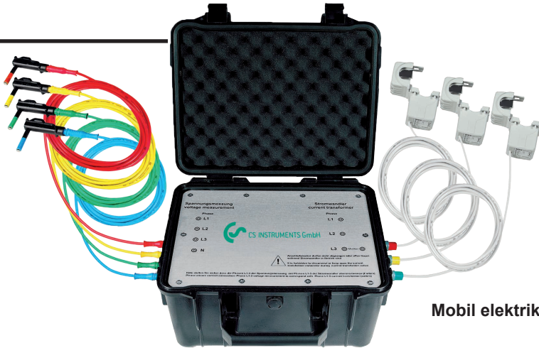
Mobil elektrik / aktif güç sayacı CS PM 600