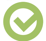
Restöl / Partikel