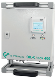
Tragegriff und Standfuß