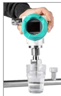
Der Sensor kann entfernt und gereinigt werden