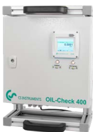
Poignée et support