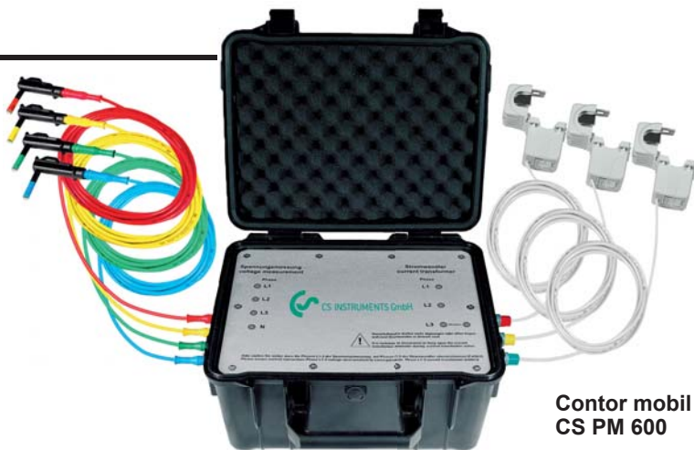
Contor mobil energie/putere efectiva CS PM 600