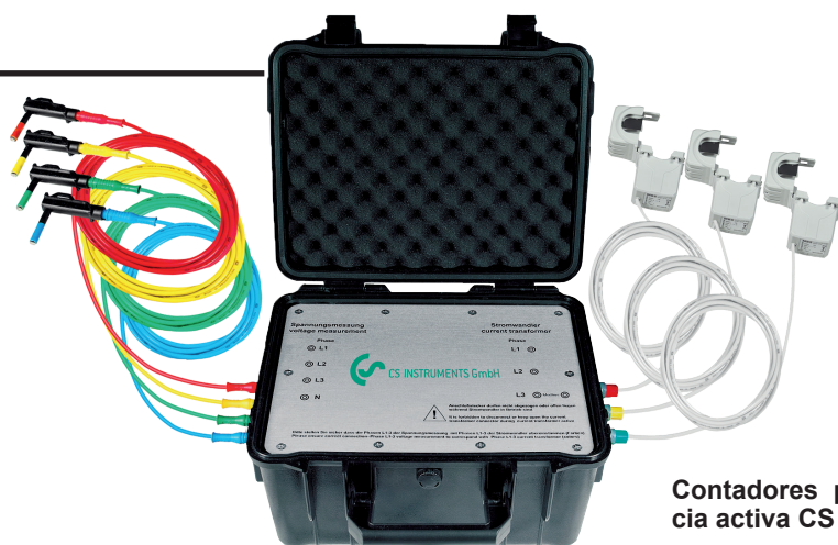
Contadores portátiles de corriente/potencia activa CS PM 600