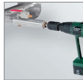
Perforación bajo presión con el dispositivo de perforación de CS

3) Gracias al amplio rango de medición de las sondas se pueden cumplir incluso las exigencias extremas de la medición del consumo (alto caudal en diámetros de tubo pequeños).