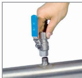
A Tubuladuras roscadas

Con ayuda del dispositivo de perforación se pueden perforar bajo presión con la válvula esférica 1/2" en la tubería existente. Las virutas de perforación se recogen en un filtro. Después se monta la sonda como se ha descrito antes en 1).