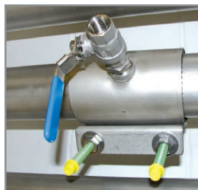
B Abrazaderas de perforado