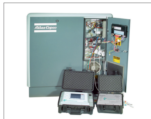
Exempel: Mätning vid kompressor

Alla mätdata överförs digitalt (Modbus) till DS 500 mobil / DS 400 mobil där de kan registreras.