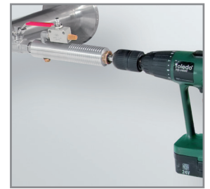
Anbohren unter Druck mit der CS Bohrvorrichtung

3) Durch den großen Messbereich der Sonden können selbst extreme Anforderungen an die Verbrauchsmessung (hoher Volumestrom bei kleinen Rohrdurchmessern) erfüllt werden.