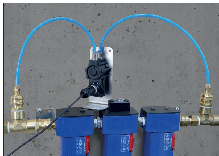
Tipico sito di impiego per la misura di pressione differenziale in collegamento con due tubicini in PE a collegati monte e valle del filtro.